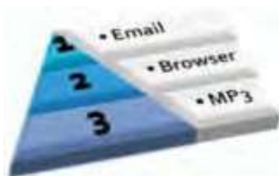
Gambar 2.25 Menggunakan bullet pada grafik