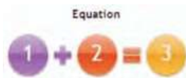
Gambar 2.26 Grafik SmartArt