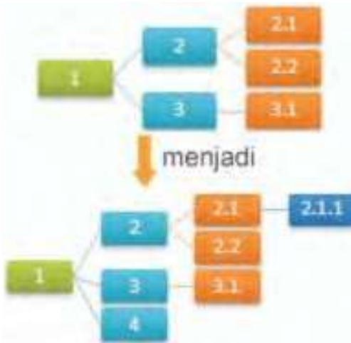
Gambar 2.23 Layout Horizontal