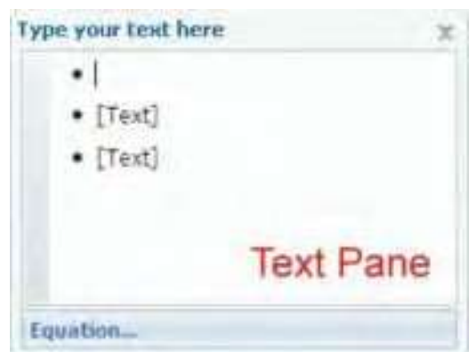
Gambar 2.28 Tampilan Text Pane