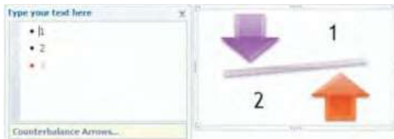
Gambar 2.24 Merubah layout