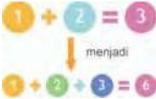
Gambar 2.22 Layout equation